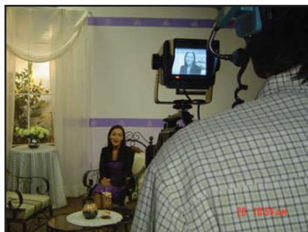
Първите предавания на АДВенир наблягали на детски програми и изучаване на Библията.

В Южна Америка два други църковни медийни центъра подписали споразумение да насочат програмите си, предназначени за университетската младеж, както и медицинските и възпитателните си теми, към АДВенир. В Северна Америка Три Ейнджълс Бродкастинг Нетуърк предложил на АДВенир достъп до всяка от програмните материали на 3 Ей Би Ен. Своята подкрепа предложил и други два медийни центъра, а втора телевизионна станция изразила интерес да препредава сигнала на АДВенир.