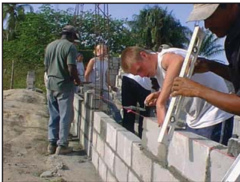
Работата върви бързо и успешно

не и да започне работа. Пристигнаха обаче само деветнадесет тона. Всеки ден доброволците смесваха чакъл с пясък и цимент, за да излеят пода. Купчинката чакъл започна явно да намалява. Накрая дойде денят, когато работниците пресметнаха, че има само за „още едно бъркало“. Тъкмо когато завършиха изливането на тази последна секция, заваля дъжд. Това спря работата по изливането на цимента – само за деня. През останалото време строяха дървените стени, които оформяха стаите и разделяха новия етаж на класни помещения и коридори.