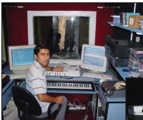
Горе: Аудиостудиото на АДВенир в Санта Круз, Боливия.

Дейвид знаеше: същият човек нееднократно бе заявявал,