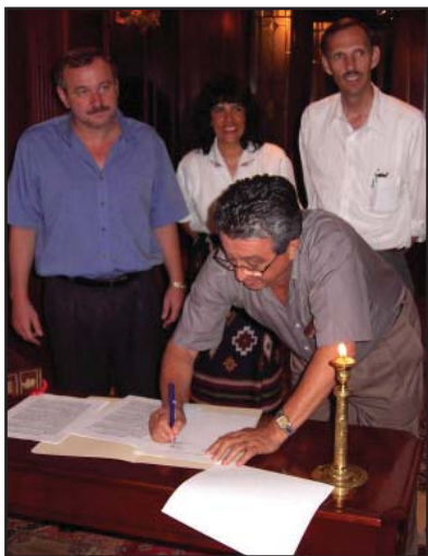
Формалното подписване на договора за продажба на мрежата на Госпъл Министриз Интернешънъл, състояло се на 31.01.2002 г. след поредица от преговори.

стави, и е в състояние да осигури средства за Своето дело, ако Неговите деца вървят напред в послушание, когато Той отваря вратите. Убедени, че земята преживява последните мигове от човешката история, те бяха убедени също, че няма проект, колкото и да струва той, който Бог да не финансира, ако бъде осъществен по Неговия начин и по Негова заповед. Успехът на Божието дело не може да бъде осуетен, освен чрез нашето собствено съзнателно непослушание и себелюбие.