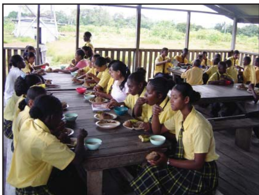
Учениците обядват в училищния стол.

Бог постоянно внушава на посветени хора да се присъединяват към растящата група от доброволци, които идват в Гвиана, за да носят бремето на тежки отговорности. Броят на доброволците се е удвоявал всяка година. Дей-