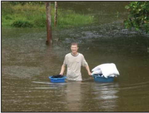
Матю край речния си дом в Кайкан по време на най-голямото прищждане на реката.

– Един човек, който беше в събота на църква, умря. Той е известен човек в селото. Всички го познават добре. В наводнената част на селото е.