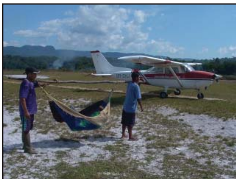
Пациент, нуждаещ се от медицинска помощ, пренасян в самолет на ГАМАС. ГАМАС спасява физическия и духовния живот на хора от най-отдалечените области на страната.