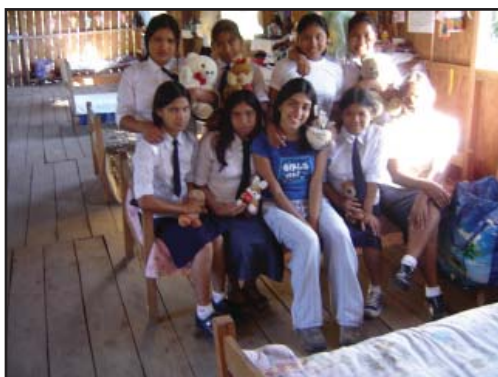
Ученички в девическото общежитие на Техническото училище „Ричард Гейтс“, Гуаярамерин, Боливия.