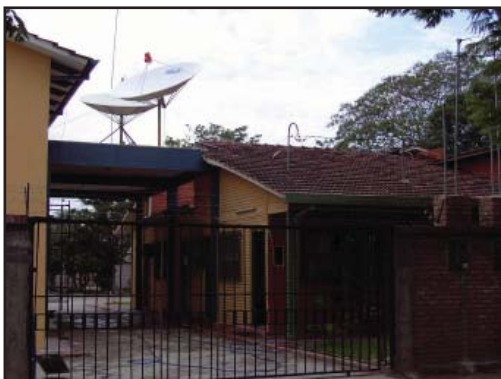
Портата на имота и офисите на АДВенир в Боливия.

Оставаше обаче големият въпрос – как Госпъл Министриз Интернешънъл ще плати мрежата? Дейвид и членовете на Изпълнителния комитет се хванаха сериозно за Божиите обещания в Библията и в Духа на пророчеството. Вярваха, че Бог може много повече, отколкото човек е способен да си пред-