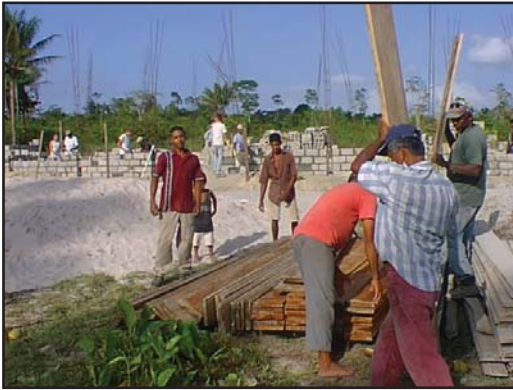
Строежът на училището напредва, като местни индианци работят заедно със студентите мисионери от САЩ.