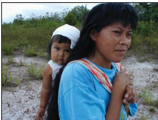
Майка с дете от Арау. Много от местните жители са загрижени за влиянието на духовите в ежедневието им живот.