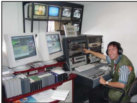
Първоначалната контролна стая на АДВенир в Санта Круз, Боливия.

„Преди да ме призват, Аз ще отговарям! И докато още говорят, Аз ще чувам!“ (Исая 65:24)