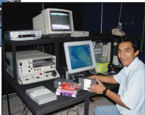
Долу: Мрежата започна национално излъчване с това първоначално оборудване през септември 2002 г.

че никога не е имал намерение да употребява парите си за да финансира мисионски начинания.