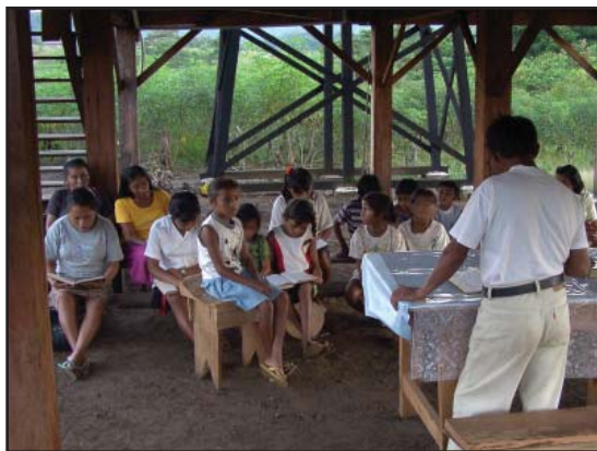
Момчета и момичета участват в съботноучилищна програма в Копинанг.