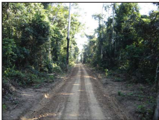
Още едно от Божиите мисионски чудеса – новият път, водещ за Техническото училище „Ричард Гейтс“.